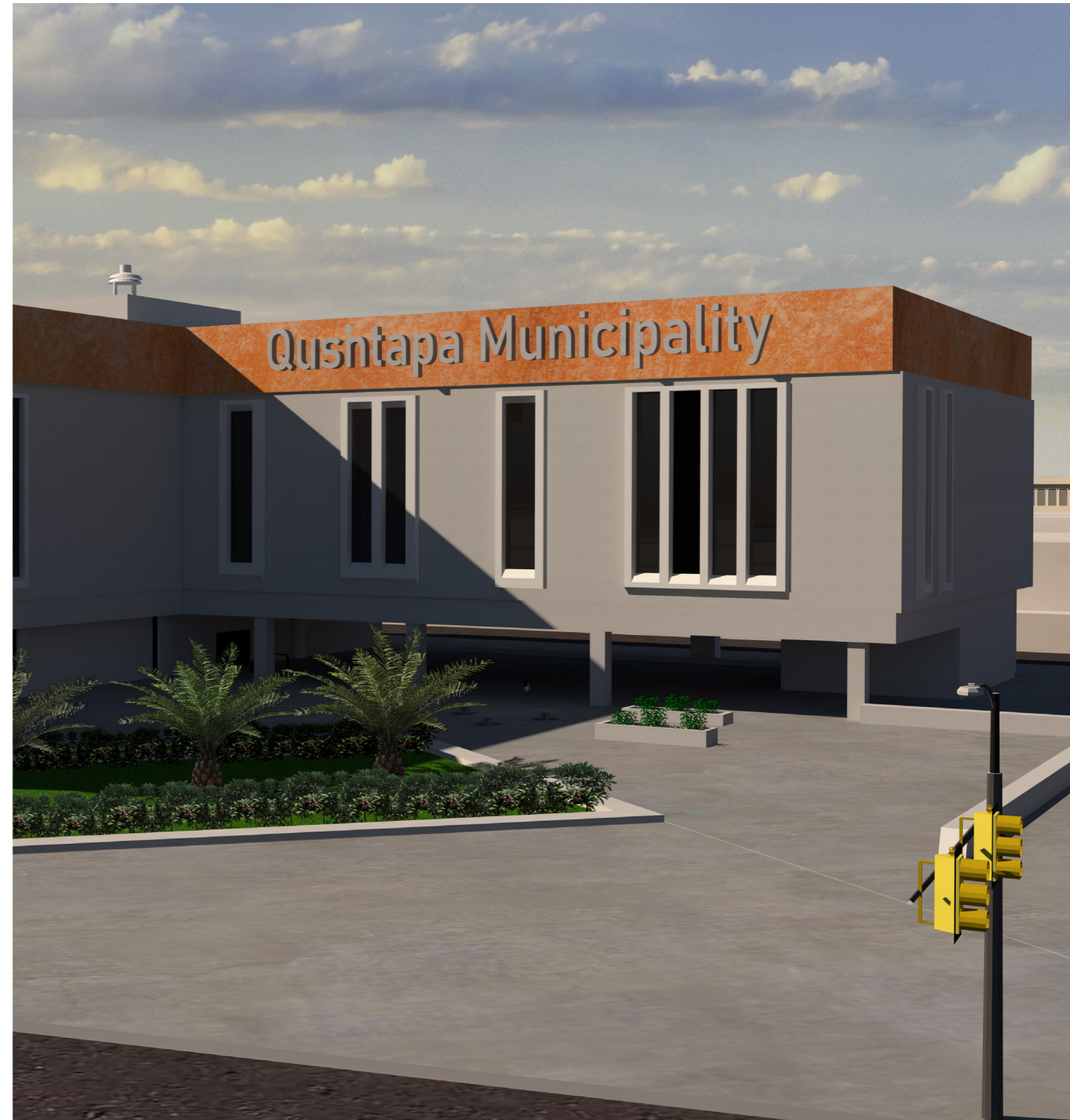
دروستكردن و نۆزەنكردنهوهى بالهخانه گشتبييه سهرهكبييهكان به گوپرهى پيوهرهكانى ئىستاو سهردهميانه دلنبايى مسۆگهر دهكات بۇ شارهوانى كه دهتوانىت خزمهتگوزاربييه سهرهكبييهكان به جوپكى باش پيشكەش به دانپشتوانهكهى بكات.