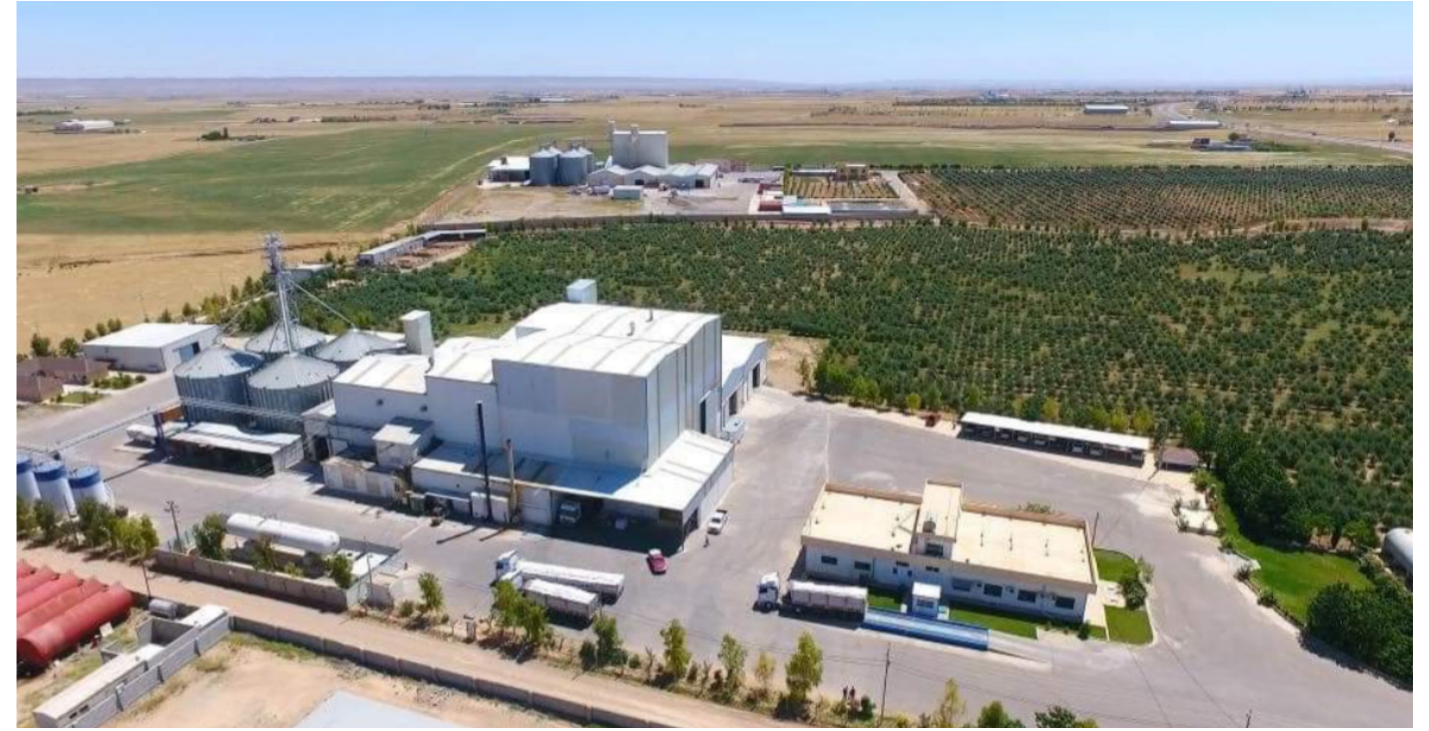
ۋىنەى سەرەۋە: قوشتەپە شوئىنېكە بۇ كۆمپانىيا گەرەكانى كشتوكالى، ۋەك كۆمپانىياى ئەربىل فىد - كۆمپانىياى ھەولېر بۇ ئالىك - (كارگەكە لە ۋىنەى سەرەۋە نىشان دراۋە)، ھەموو ئەمانە پشت بە وزەى متمانەپىكراۋ دەبەستن. ۋىنەى خوارەۋە: جىبەجىكردنى ھېلى كارەباى نوئى لەلايەن رىكخراۋى UNHCR ەۋە لە ئىستاۋە بەردەۋامە.