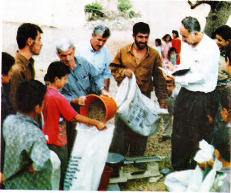
كۆكردنه ودى سن و كيسه له هاوپنه ههواردا